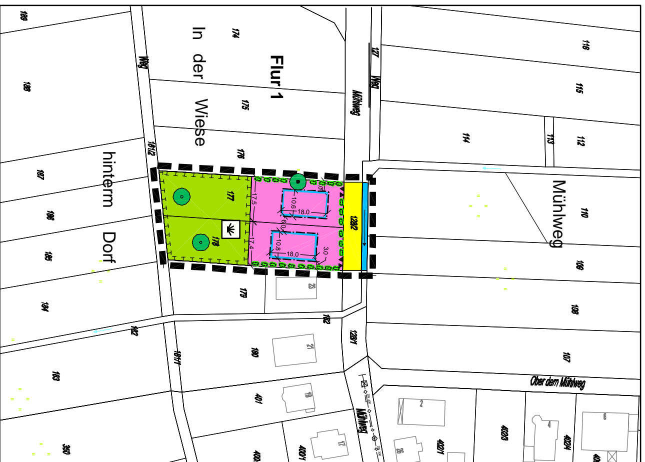
Ausgleichsfläche Flur 1, Flurstück 185 in der Gemarkung Hintermeilingen