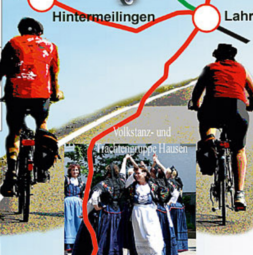
Volkstanz- und Trachtengruppe Hausen