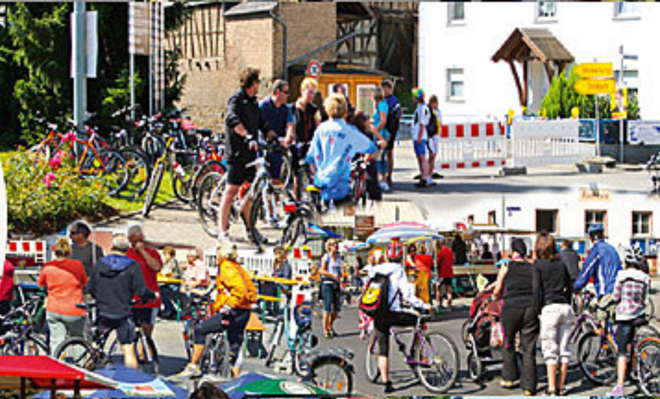
Original Waldbrunner Blaskapelle