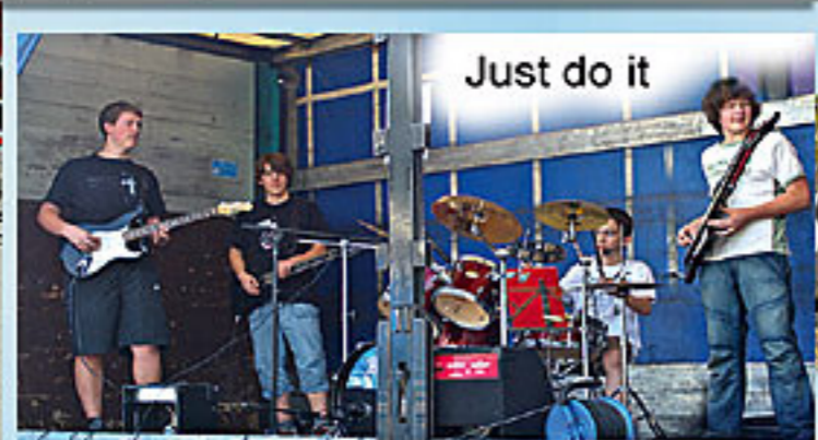
Just do it