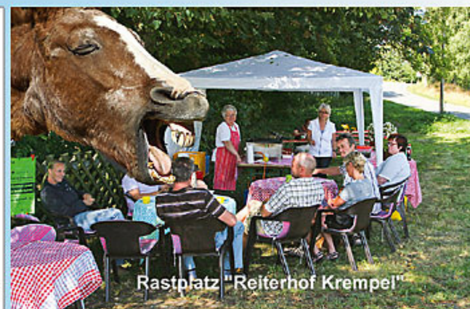
Rastplatz "Reiterhof Krempel"