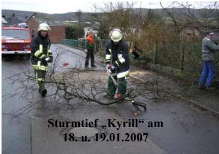
Sturmtief „Kyrill“ am 18. u. 19.01.2007