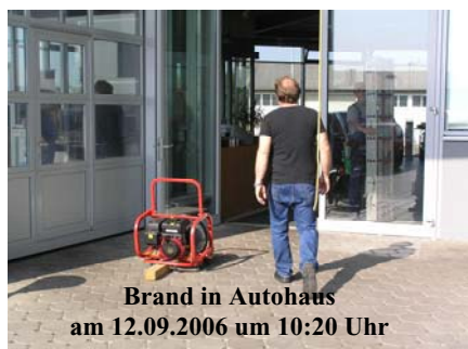
Brand in Autohaus am 12.09.2006 um 10:20 Uhr

Übrigens war Waldbrunn die erste Gemeinde im Landkreis Limburg-Weilburg, die zum Wohle der Bevölkerung eine Tageseinsatzgruppe gebildet hat. Ein Grund mehr, das zehnjährige Bestehen zu feiern. Alle Mitglieder der Einsatzabteilungen, Alters- und Ehrenabteilungen und Jugendfeuerwehren sind hierzu am Samstag, 18.08.2007 ab 16:00 Uhr herzlich ins Gerätehaus Füssen eingeladen. Zuvor findet um 15:00 Uhr eine Übung statt.