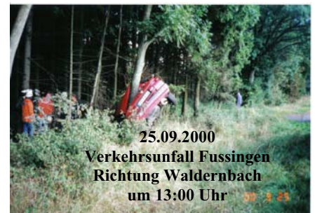
25.09.2000 Verkehrsunfall Füssen Richtung Waldernbach um 13:00 Uhr