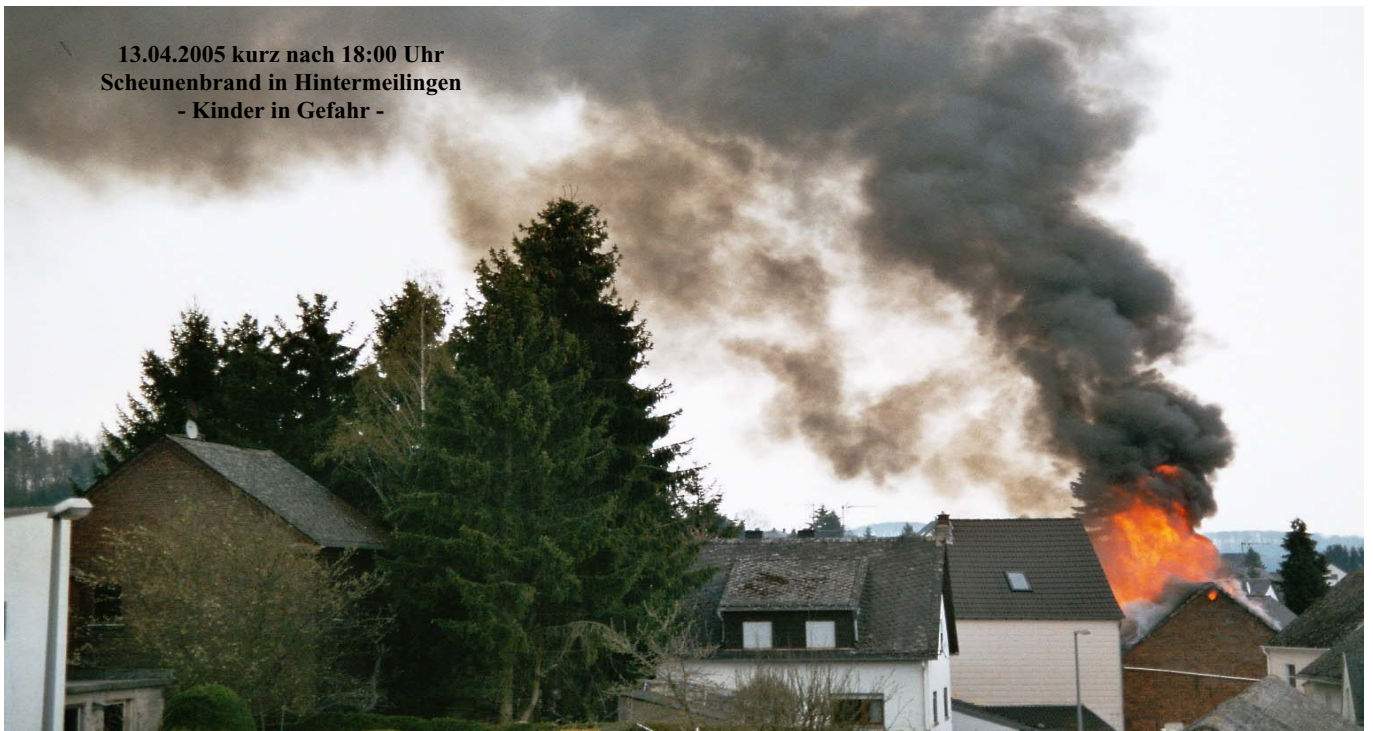
13.04.2005 kurz nach 18:00 Uhr Scheunenbrand in Hintermeilingen - Kinder in Gefahr -

„Unser Feuer“ war ab sofort „Unser Feuer“