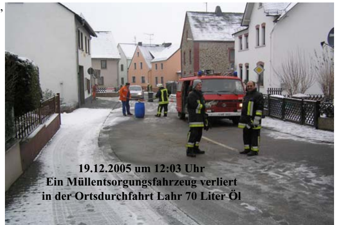
19.12.2005 um 12:03 Uhr Ein Müllentsorgungsfahrzeug verliert in der Ortsdurchfahrt Lahr 70 Liter Öl

- Pioniergeist war gefragt - Nachdem der Wehrführerausschuss sich einig war, die Tageseinsatzgruppe auf den Weg zu bringen, musste die Brandschutzaufsicht ihr OK geben. Parallel dazu wurde eine Organisation notwendig, um die Alarmierung der Einsatzkräfte zu gewährleisten. Und letztendlich war eine interne und externe Öffentlichkeitsarbeit sehr wertvoll, denn: