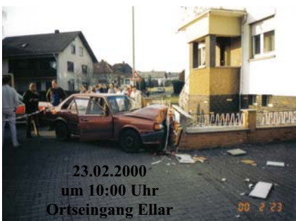
23.02.2000 um 10:00 Uhr Ortseingang Ellar