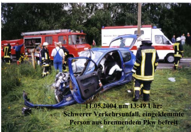
11.05.2004 um 13:49 Uhr: Schwerer Verkehrsunfall, eingeklemmte Person aus brennendem Pkw befreit