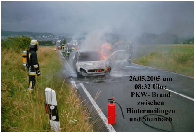
26.05.2005 um 08:32 Uhr: PKW- Brand zwischen Hintermeilingen und Steinbach

Nachdem also die Tageseinsatzstärke festgestellt war und es sich zeigte, dass viele Ortsteilfeuerwehren am Tage kaum in der Lage waren, mit ausreichender Anzahl von ausgebildeten Feuerwehrkameraden einen Einsatz vorschriftsmäßig abwickeln zu können, wurde mit dem Ziel anderen Menschen zu helfen und dem Bestreben dies optimal zu tun, im Februar 1997 die Tageseinsatzgruppe ins Leben gerufen.